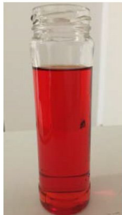
Seiner roten Farbe entsprechend wurde der Hochleistungswärmeträger „Heizungsblut“ genannt.

Ein weiterer Vorteil ist der, dass hier im Gegensatz zu Wasser Korrosion verhindert wird. Auch Leitungsbruch durch Vereisung ist völlig ausgeschlossen. „Heizungsblut“ erfüllt alle Anforderungen nach VDI Vorschrift 20/35, bezüglich PH-Wert, Grad deutscher Härte, elektrischen Leitwert, keine Mineralien, Sauerstoffbindung, keine Verkalkung und Verschlämmung. In Referenzobjekten konnte der Effekt in der Praxis gezeigt werden.